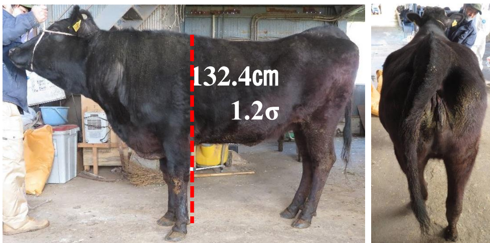
花清570の8—安福久—光平福、26.9カ月齢 1産目 孝隆平